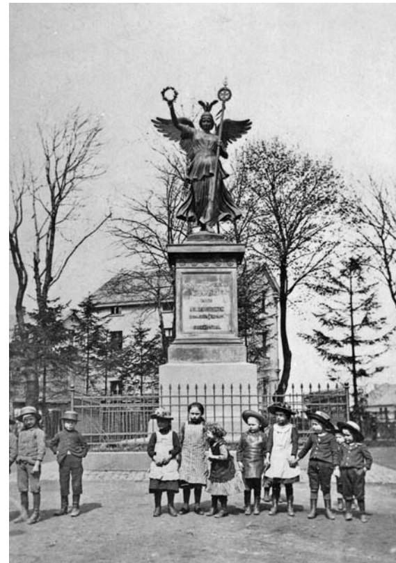
Siegessäule, Breslauer Straße um 1900