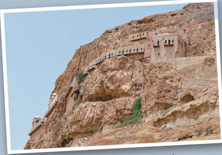
Der Berg der Versuchungen. In den Felsen liegt das griechisch-orthodoxe Kloster „Quarantal“. Unter dem Altar befindet sich der Stein, auf dem Jesus gesessen haben soll. Matthäus 4,1-11