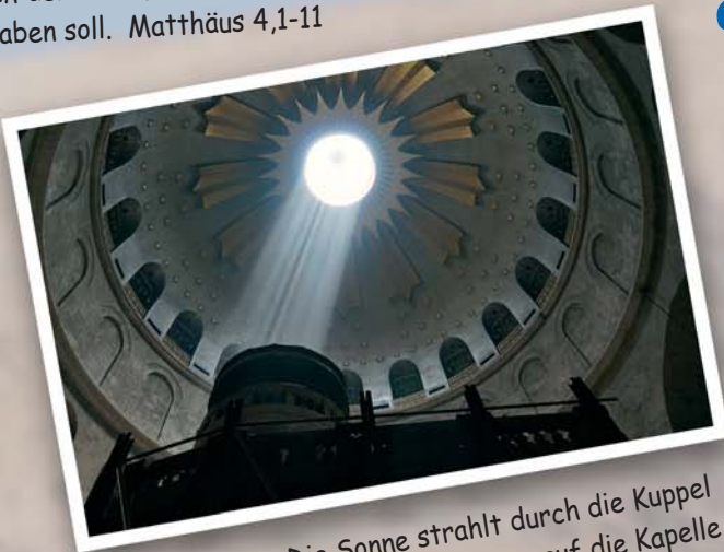
Die Sonne strahlt durch die Kuppel der Grabeskirche genau auf die Kapelle des heiligen Grabes Jesu.